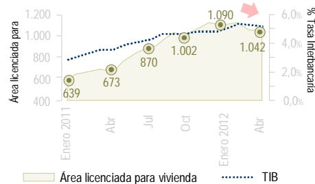
Área licenciada para construcción de vivienda en el AMB